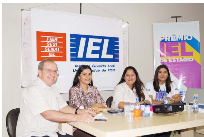
Banca avaliadora e a Gerente de Estágio do IEL-RR

O Prêmio IEL de estágio acontece anualmente para identificar e di-