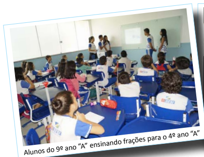
Alunos do 9º ano “A” ensinando frações para o 4º ano “A”