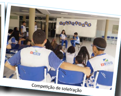
Competição de soletramento

Ensinar é um grande desafio, despertar o interesse de crianças e adolescentes requer o exercício da criatividade. Foi isso que a equipe do Centro de Educação do Trabalhador João de Mendonça Furtado – CET fez na manhã do dia 26 de agosto, inovou em suas aulas com o objetivo de proporcionar aos alunos uma forma prática de aprendizado e fixação do assunto estudado.